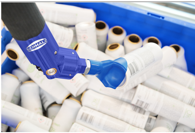
Ventouse SVE pour retirer les bombes aérosol d'un bac.